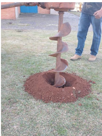
Figuras 1 e 2 – Perfuração do ponto P1 com o material retirado do local

Da mesma forma, o segundo ponto foi realizado uma perfuração de 100cm, observado uma camada superficial de 5cm de vegetação e 95cm de base em argila.