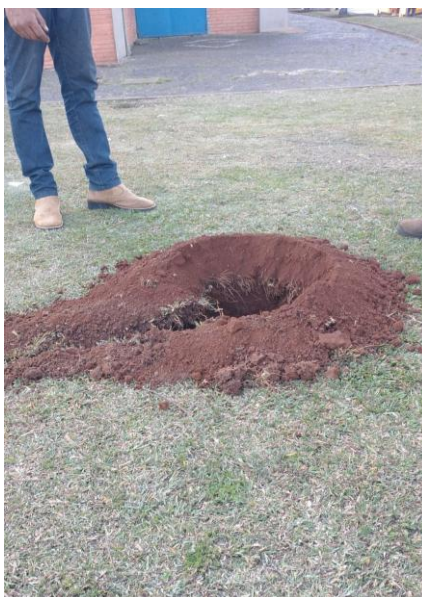
Figuras 3 e 4 – Perfuração do ponto P2 com o material retirado do local

Pode-se observar que em grande parte do material encontrado é argiloso, representando um material ótimo para compactação que não indica riscos de deformações no solo.